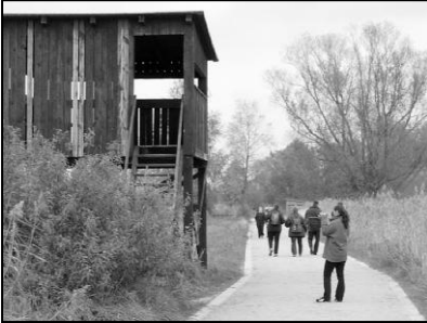
Linumer Teiche (Aussichtsturm)

Storchenschmiede Linum: Nauener Str. 54, Tel. 033922-50500 www.berlin.nabu.de (siehe hier: „Projekte & Aktionen“)