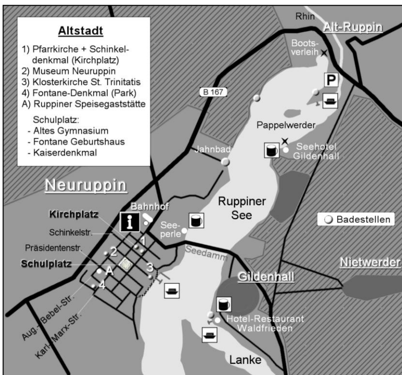
Karte 7: Neuruppin (Altstadt, Ruppiner See und Details)

Ein Blick auf den Ortsplan von Neuruppין erleichtert die Orientierung in der Altstadt und das schnelle Auffinden der Seepromenade. West- und Ostteil der Stadt sind durch den Seedamm miteinander verbunden. Auf dieser Achse führt auch die Bahnlinie entlang.