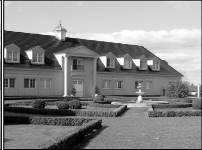
Gut Hesterberg bei Lichtenberg

Lindow sticht sowohl kulturell als auch mit seiner Naturumgebung heraus. Die dörfliche Drei-Seen-Stadt kann ihren Besuchern eine Klosterruine und die privat betriebene Klostersmühle vorweisen. Sogar eine Bootsfahrt auf dem Gudelacksee wird angeboten.