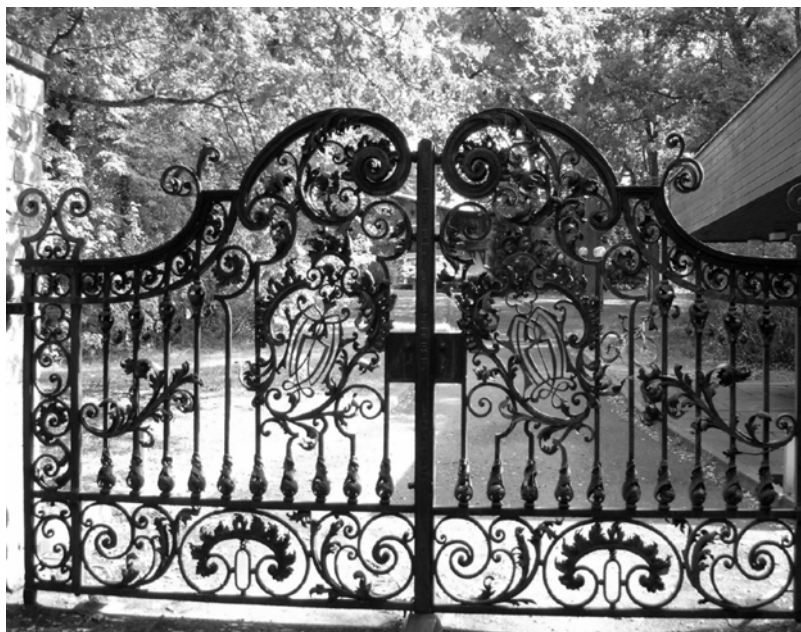
Oben: Hintereingang zum Jagdschloss.