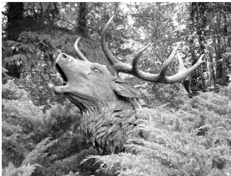
Unten: Große Bronzefigur