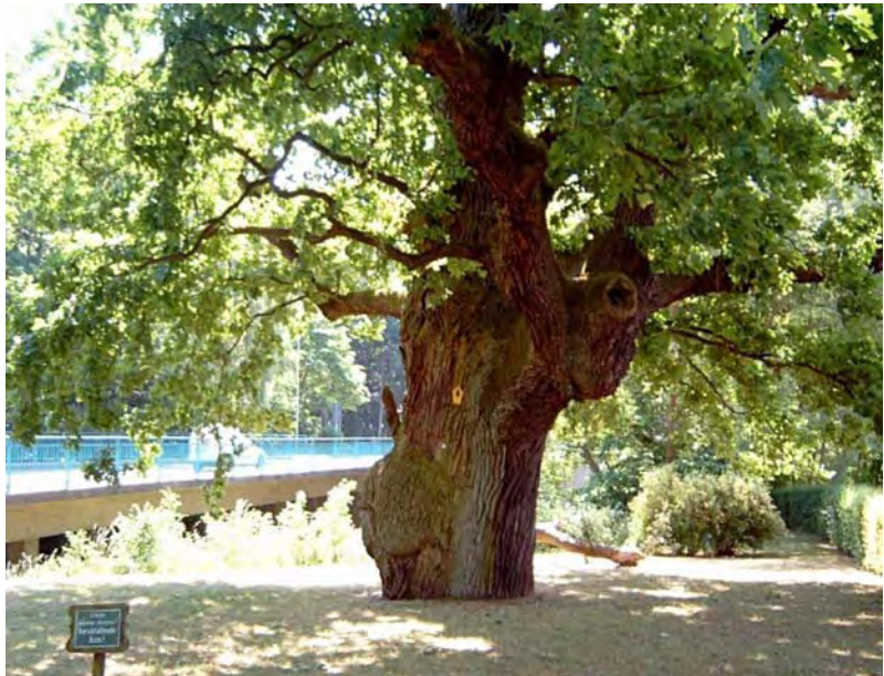
Unten: Friedenseiche Eichhorst